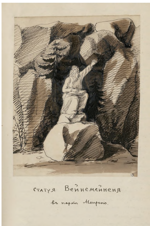
Илл. 86. Тюменев И. Ф. Моя автобиография. Т. 2. 1874–1876. Рисунок «Статуя Вейнемейнена в парке Монрепо», приклеенная к листу рукописи. 1875 г. Перо, тушь, сепия. ОР РНБ. Ф. 796. Оп. 1. № 8. Л. 163