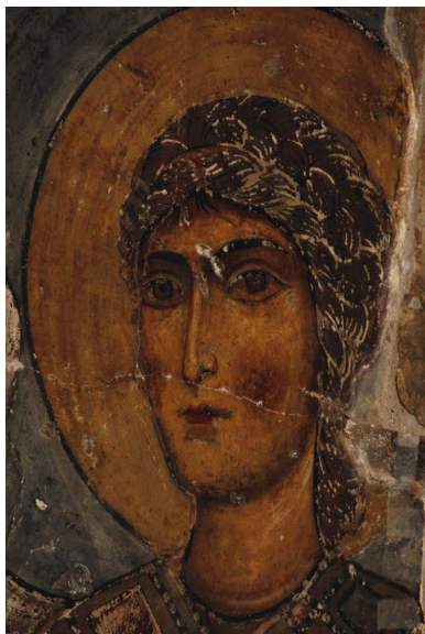
Илл. 41. Лик архангела. Фрагмент росписи восточной апсиды Атенского Сиона. Фото И. А. Орецкой, 2023