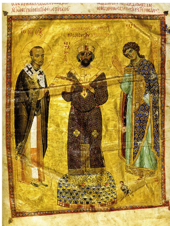
Илл. 36. Св. Иоанн Златоуст, архангел Гавриил и император Михаил VII. Миниатюра рукописи Слов Иоанна Златоуста (Paris, BnF, Coislin 79), fol. 2v. 1078–1081 гг.