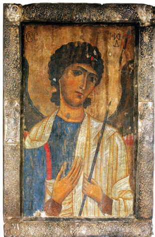
Илл. 34. Архангел Михаил. Икона. Община Кала, церковь свв. Кирика и Иулитты (Лагурка). Воспроизводится по: 100 Georgian Icons / Text by N. Burchuladze. Tbilisi: Karchkhadze Publ., 2023. P. 50