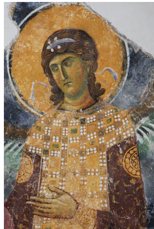
Илл. 37. Архангел. Фрагмент фрески апсиды верхнего яруса костницы монастыря Успения Пресвятой Богородицы в Бачково.