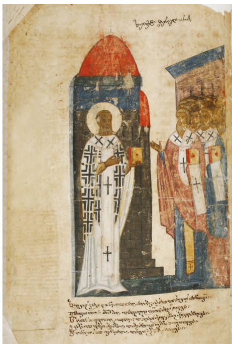
Илл. 39. Григорий Назианзин и 150 епископов. Миниатюра рукописи Гомилий Григория Назианзина (Тбилиси, Национальный центр рукописей, А-109), с. 276. Воспроизводится по: Karanadze M., Shatirishvili L., Chkhikvadze N., Abuladze T. Georgian Manuscript Book. 5 th –19 th centuries. Album. Tbilisi: K. Kekelidze Georgian National Centre of Manuscripts, 2018. P. 63