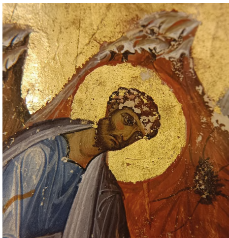
Илл. 38. Евангелист Лука. Фрагмент миниатюры Четвероевангелия (Venezia, BNM, gr. Z. 27 (=341)), fol. 165v.