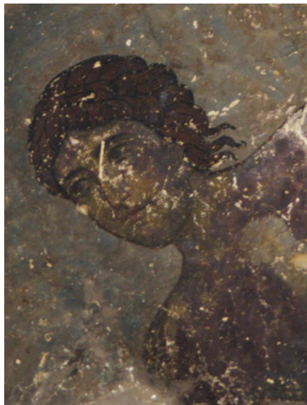
Илл. 42. Лицо персонификации реки Нил. Фрагмент росписи северо-восточного тромпа Атенского Сиона.