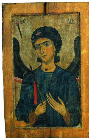
Илл. 35. Архангел Гавриил. Икона. Местия, Музей истории и этнографии Сванетии.