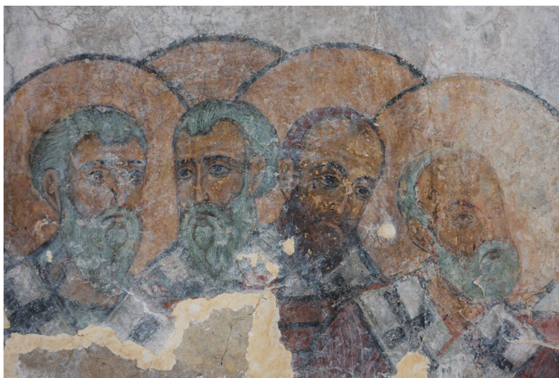
Илл. 43. Святители. Фрагмент росписи нартекса монастыря Гелати.